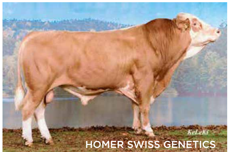
HOMER SWISS GENETICS