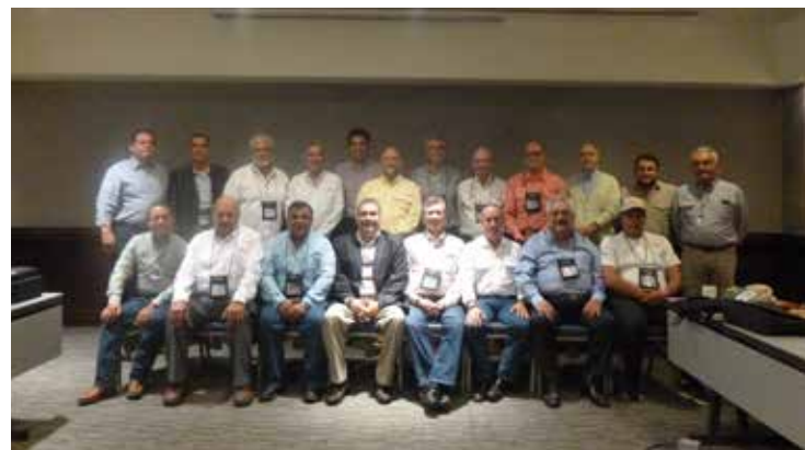
II Congreso Simmental Simbrah de las Américas

• Además las bases para realizar investigaciones en conjunto de nuestra Asociación con las Asociaciones de Brasil, Costa Rica, Colombia y Guatemala para que el INIFAP realice las evaluaciones genéticas de nuestros animales y hacer una base de datos más amplia de trabajo que nos ayudará a identificar a los mejores ejemplares.